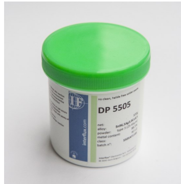
Abgebildetes Produkt kann vom gelieferten Produkt abweichen

Die Klassifizierung gemäß IPC und EN ist RO LO .